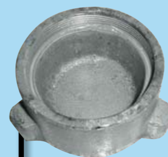
GORRETES 1,5 KG.