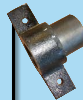
SOPORTES 3,8 KG.