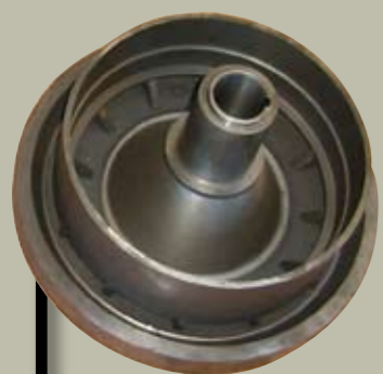
VOLANTES 20-25 KG.