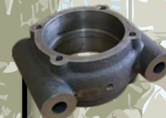
CARCASAS 6 KG.