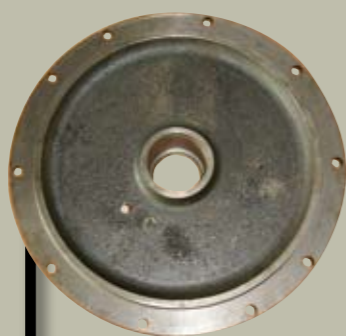
TAPAS CILINDRO 10 KGS.