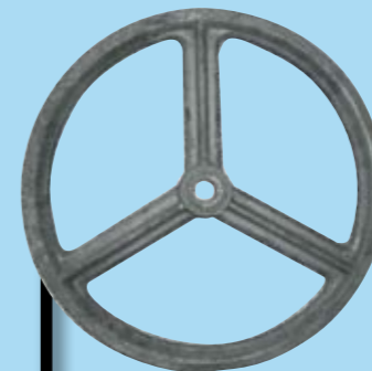
RUEDAS BASCULANTE 4 KG.