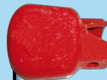
CONTRAPESOS 1,5 KG.