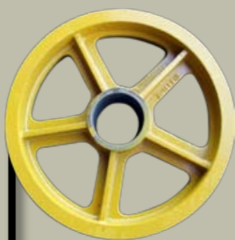
POLEAS 3-37 KG.