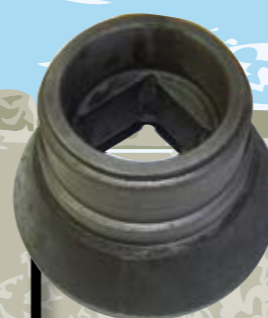
BUJES 5 KG.