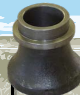
SEMICARRETE 4 KG.