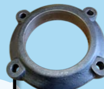
TAPAS 1,3 KG.