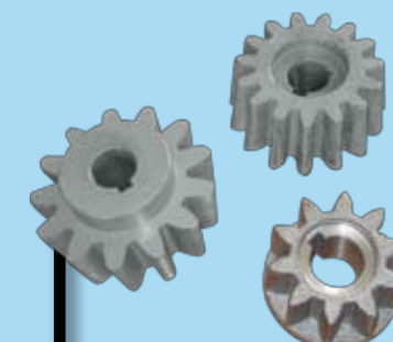
PIÑONES 0,4-2 KG.