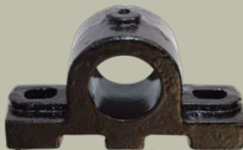
SOPORTES 2,6 KG.