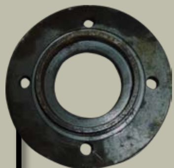
TAPAS SINFIN 1,5 KG.