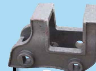
BRAZOS 6 KG.