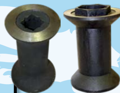
CARRETES SEPARADORES 9-14 KG.